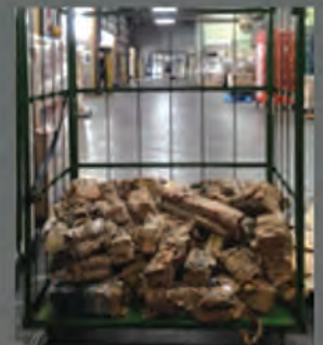
圧縮してコンパクトに