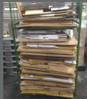
カゴコンテナいっぱい段ボール