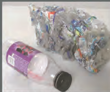
圧縮されたペットボトル